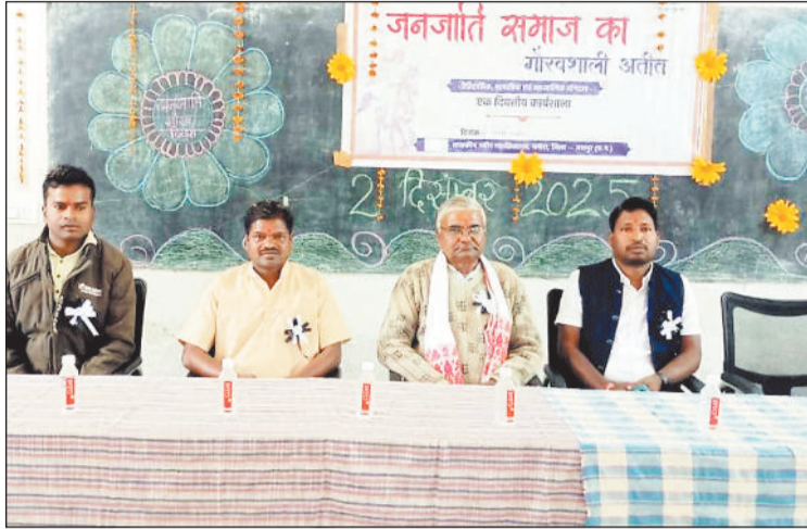
हरिभूमि न्यूज ►► जशपुरनगर

शासकीय नवीन महाविद्यालय मनोरा में भगवान बिरसा मुंडा की 150 वीं जयंती पर जनजातीय समाज का गौरवशाली अतीत, ऐतिहासिक, सामाजिक एवं आध्यात्मिक योगदान विषय पर एक दिवसीय कार्यशाला का आयोजन किया गया।