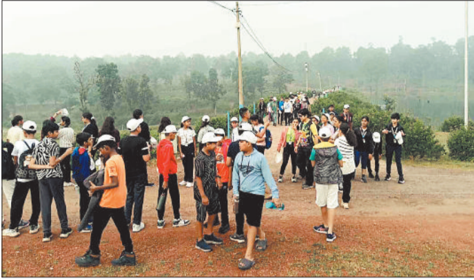
मैनापाट में पर्यटकों की भीड़।