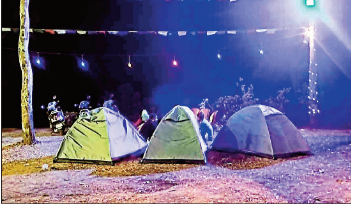
पर्यटकों के लिए सजे टेंट।